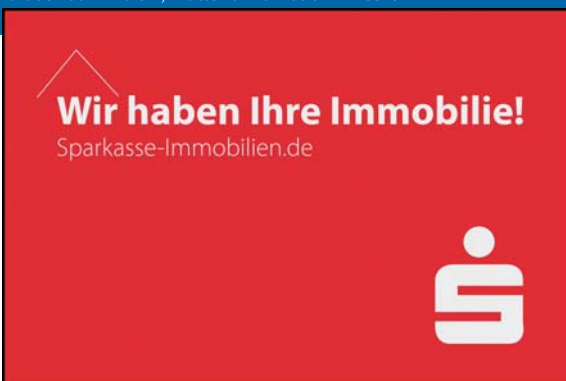
Größe 180 x 120 cm, Matte zu Promotion-Zwecken