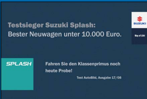
Größe 180 x 120 cm, Matte zu Promotion-Zwecken

Der perfekte Blickfang zu Promotion-Zwecken.